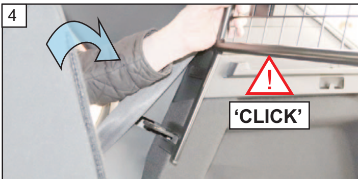
4 Check Guard is centred. Close Seats back. Stellen Sie sicher, dass Gitter zentriert ist. Sitze schließen