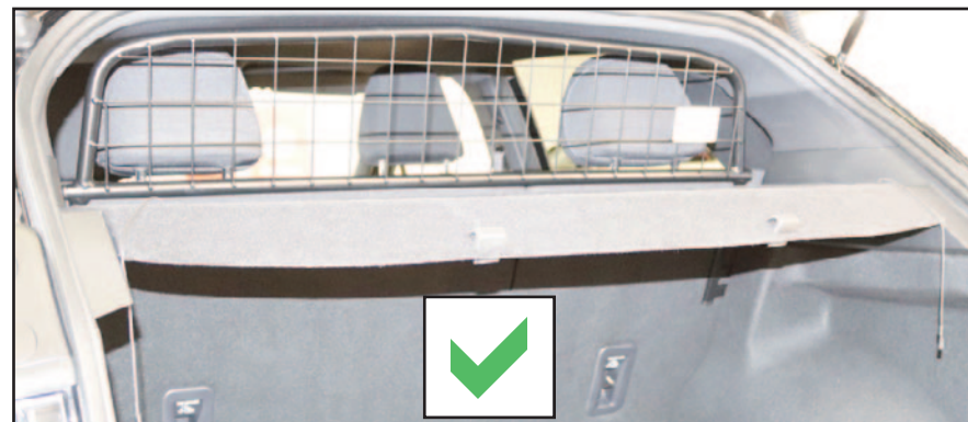
Fit parcel shelf if required / Installieren Sie die Hutablage, wenn Sie möchten