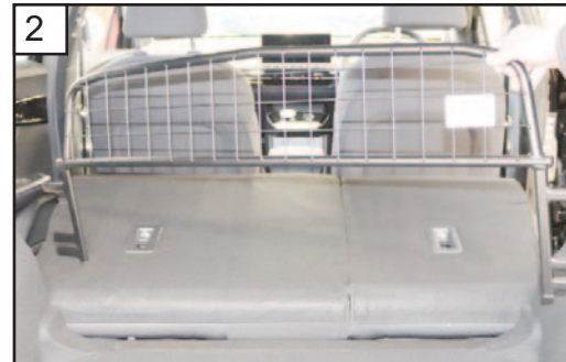
2 Insert Guard - Badge to the back of car Teil einfügen - Plakette zum Fahrzeugeck hin