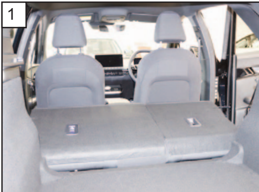
1 Drop rear seats / Rücksitze fallen lassen

READ FULLY BEFORE BEGINNING - IT'LL MAKE MORE SENSE! VOR DEM ANFANG VOLLSTÄNDIG LESEN - ES WIRD MEHR SINN MACHEN!